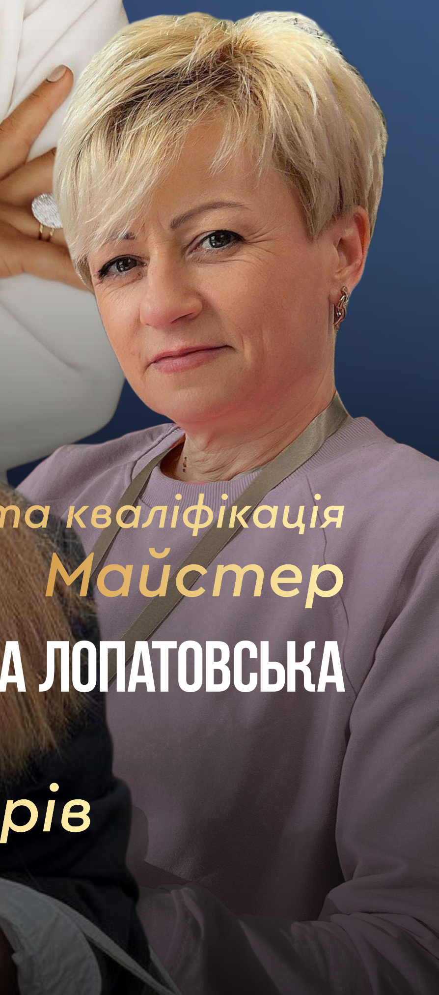
Відкрита кваліфікація Майстер