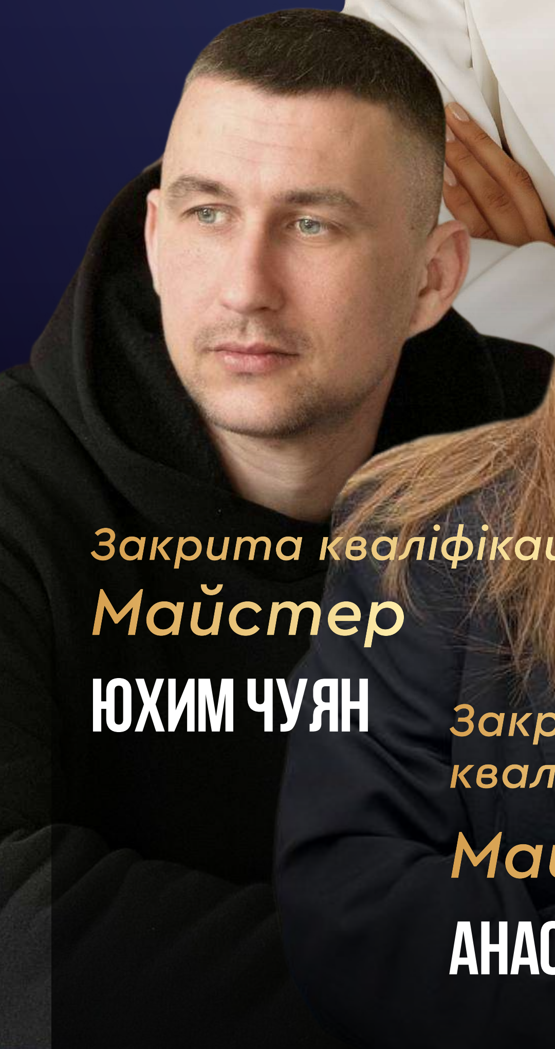
Закрита кваліфікація Майстер